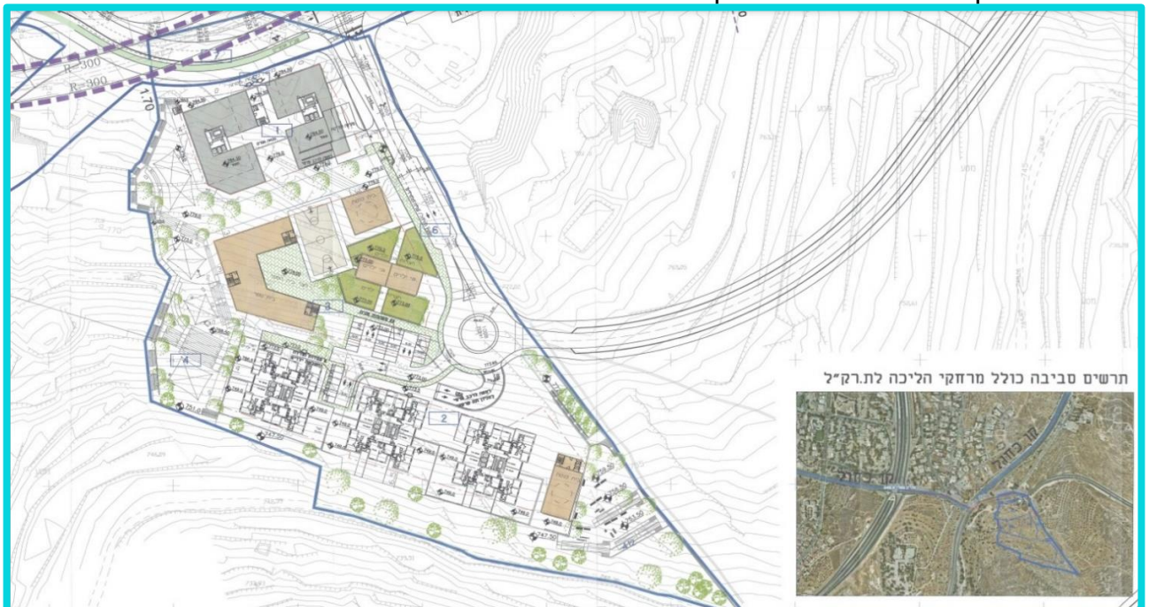
בתמונה מוצגת התכנית המאושרת בתב"ע מס 028544.