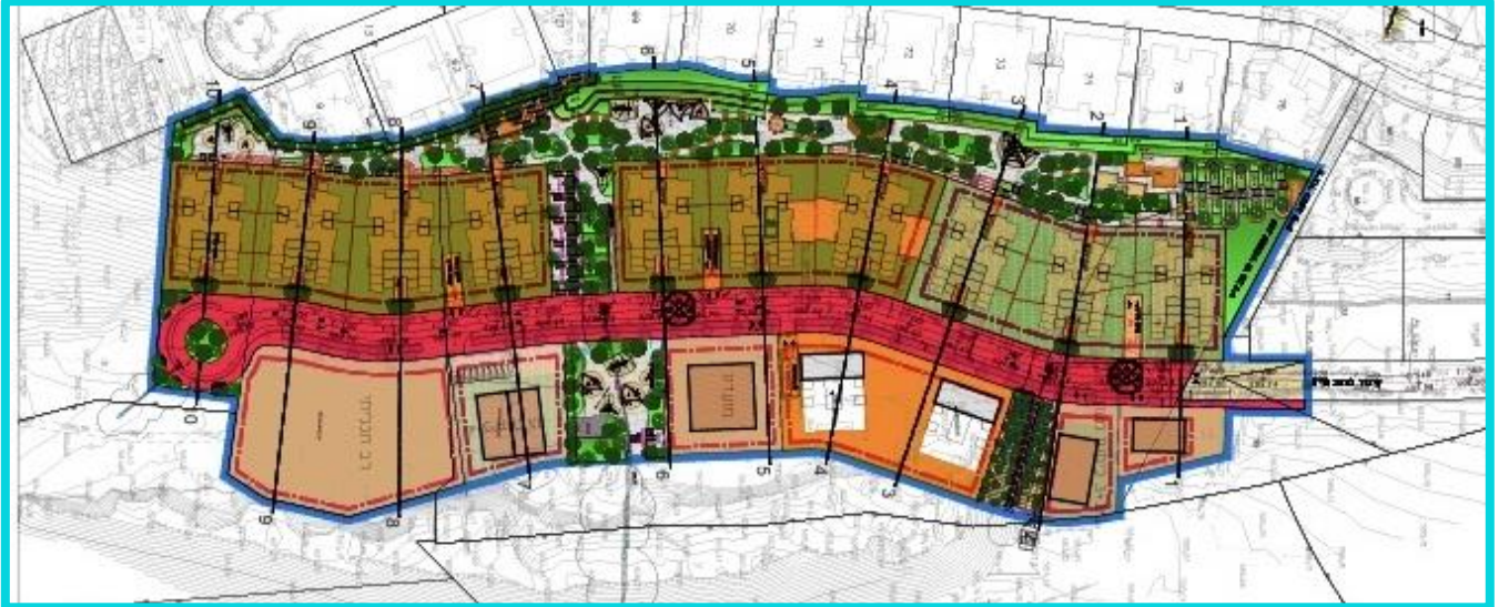
בתמונה מוצגת התכנית המוצעת של שלב ג' מזרח.