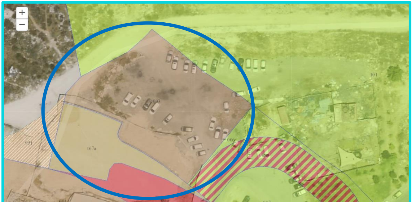
תב"ע 1299254 למבנים ומוסדות ציבור ודיור מוגן – תצא של השטח כיום זה על מגרש חניה קיים (מסומם בכחול).