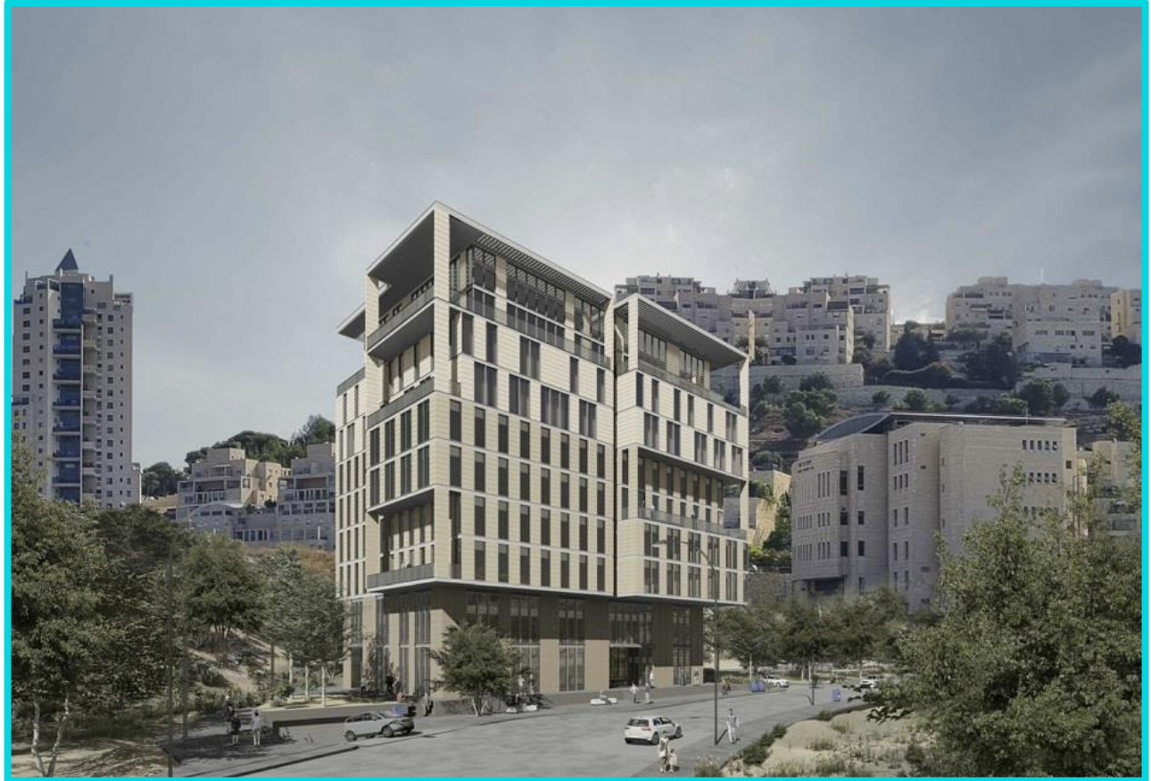
תכנית למבנים ומוסדות ציבור ודיור מוגן.